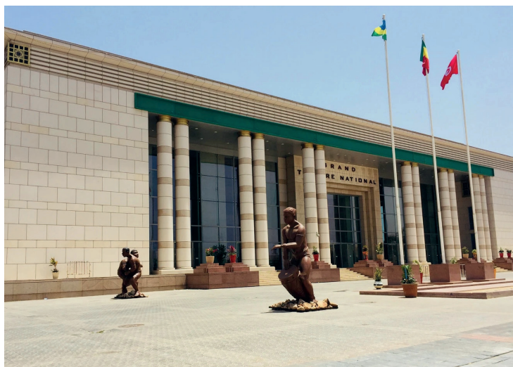
Grand Théâtre National