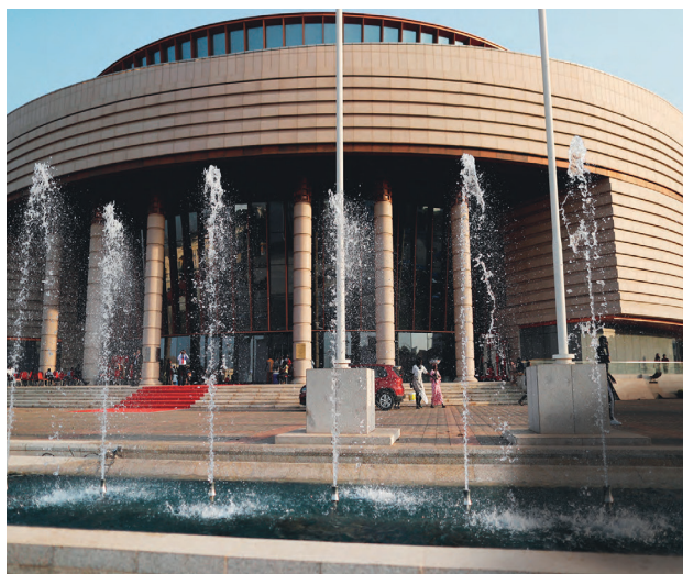
Musée des Civilisations Noires

Une déclaration politique finale et une feuille de route du Forum Mondial de l'ESS GSEF DAKAR 2023 seront adoptées et présentées lors de la clôture.