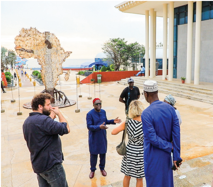
Place du Souvenir

La place du souvenir et l'hôtel de Ville seront au cœur du dispositif culturel lors du GSEF Dakar 2023. Les activités se feront en parallèle à la place du souvenir et à l'hôtel de ville de Dakar. Au niveau de la Place du Souvenir africain, il sera organisé :